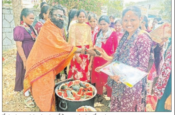
చేస్తున్న వితరణకు సంతోషాన్ని వ్యక్తం చేశారు.