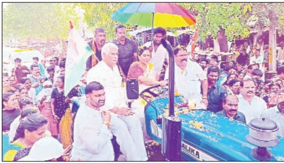
శ్రేణులలో మరింత ఉత్సాహాన్ని నింపారు. ఈ కార్యక్రమంలో కాంగ్రెస్ పార్టీ నాయకులు తదితరులు పాల్గొన్నారు.